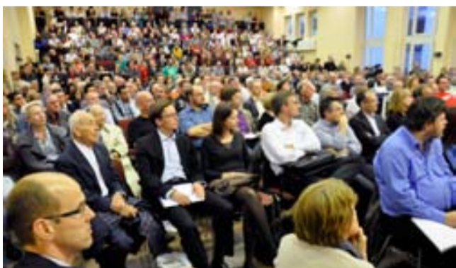
Die Auftaktveranstaltung im Frankfurter Jugendhaus

Fazit: Die Herbstaktionen waren für die LINKE ein guter Vorwahlkampf. Ab 1. Januar werden die sozialen Kürzungen richtig spürbar. Dann müssen wir den Unmut der Menschen über den Wahltag am 27ten März hinaus organisieren.