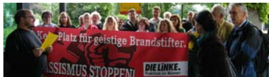
Römerfraktion und Kreisvorstand veranstalten Spontanprotest

Es war reiner Zufall, dass Sarrazin im Frankfurter Römer einen Genossen fragte, wo denn das WC sei. Der reagierte schnell und genauso die Römerfraktion und der Frankfurter Kreisvorstand. Mit der Parole „Kein Platz für geistige Brandstifter!“ störten sie im Kaisersaal des Römers, das Frankfurter Rathaus, ein Treffen von Vermögensberatern, die Sarrazin eingeladen hatten. Die Räumung erfolgte schnell, Fotos wurden beschlagnahmt.