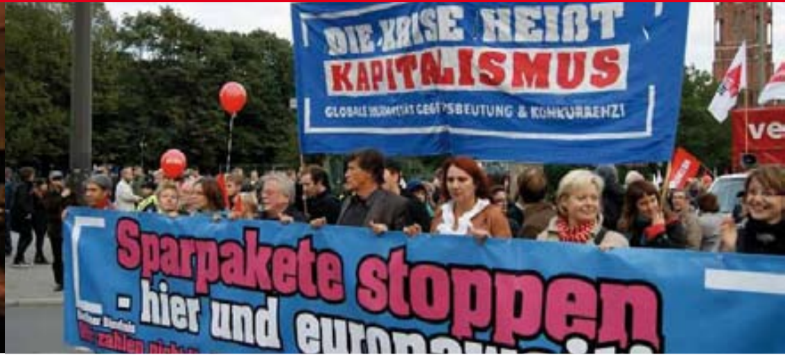
Berlin: Proteste gegen das Sparpaket der Bundesregierung am 29. September