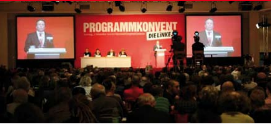
Kassel: Über 600 Linke diskutierten am 07. November das neue Parteiprogramm.