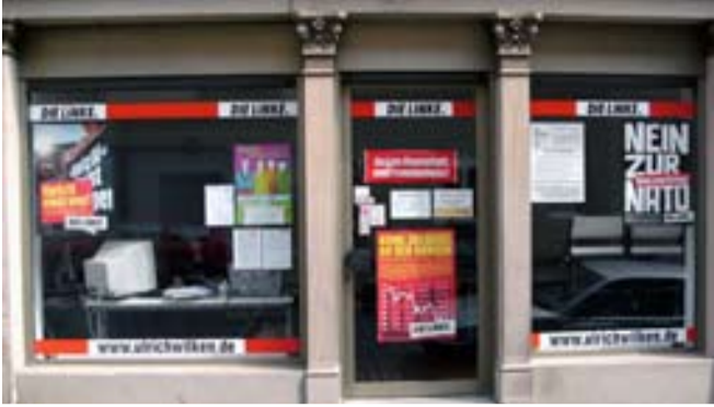
Klein, aber fein: Wahlkreis- und Kreisverbandsbüro im Wiesbadener Bergkirchenviertel